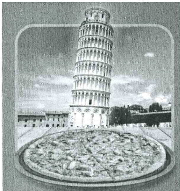
Experiență în Pisa