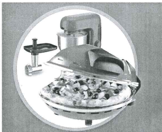
Kit pentru home pizza