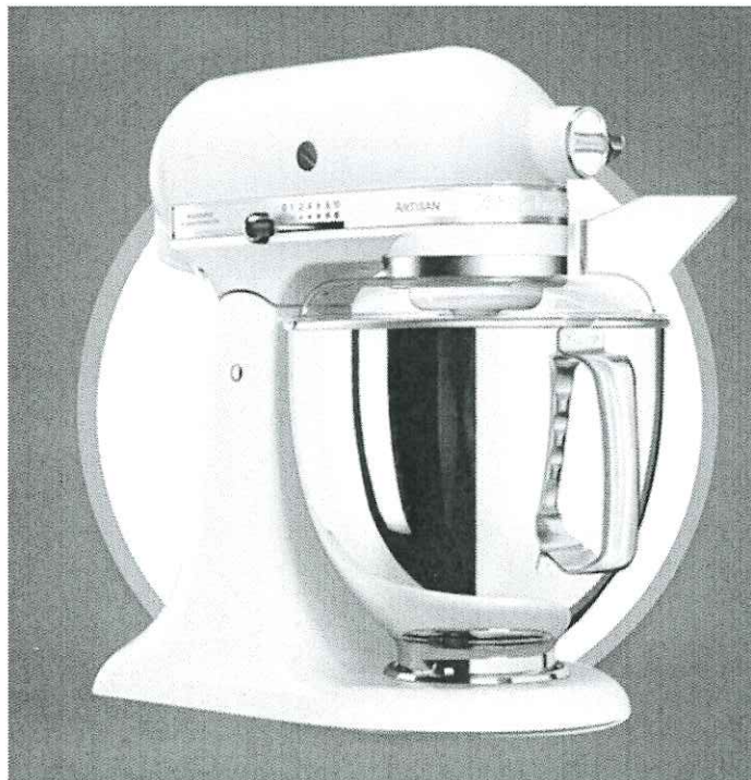
Mixer cu bol KitchenAid Artisan