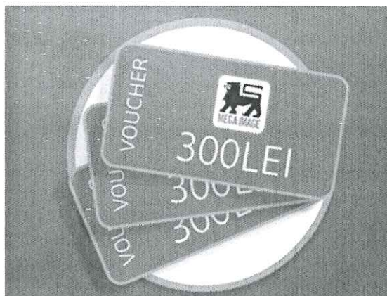
Voucher cumpărături Mega Image în valoare de 300 LEI

*Imaginile premiilor sunt cu titlu informativ