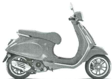
Scuter Vespa Primavera 50 Red '22